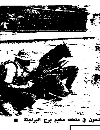
مسلحون في منطقة مخيم برج البراجنة